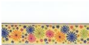
Kornblumen auf gelb ( Nr. 18)