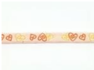
Herzen (Nr. 65)