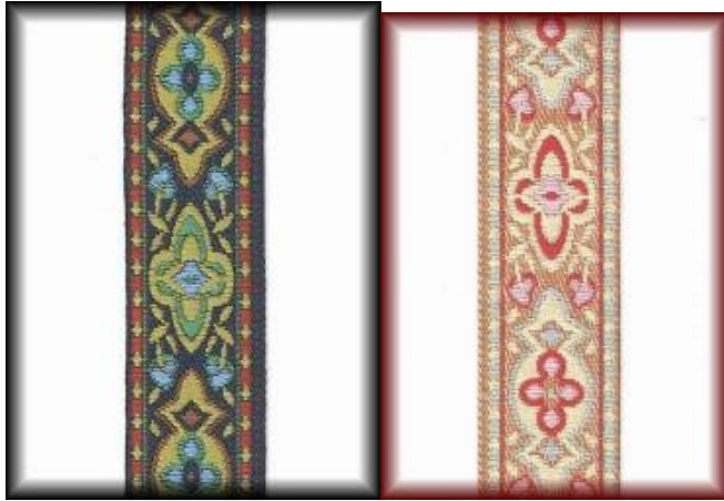
Tundra bunt (Nr. 83) und hell(Nr. 84)