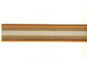
Streifen braun/beige (Nr. 63)