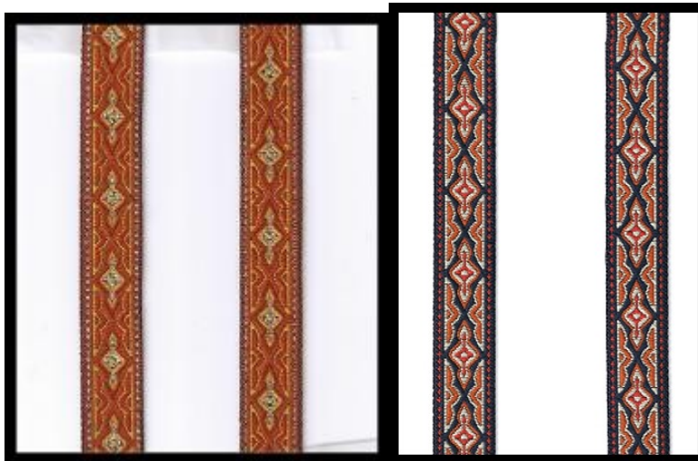
Lava orange (Nr. 73) und blau(Nr. 74)