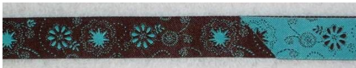
braun türkis (Nr. 10) oder türkis braun( Nr.11)