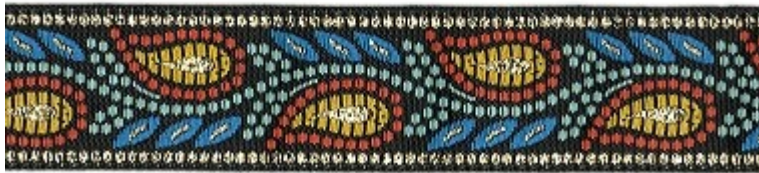
Zauberranke rot ( Nr.12a) Zauberranke blau ( Nr. 12b) Zauberranke lila ( 12c) Zauberranke blauorange ( 12d)